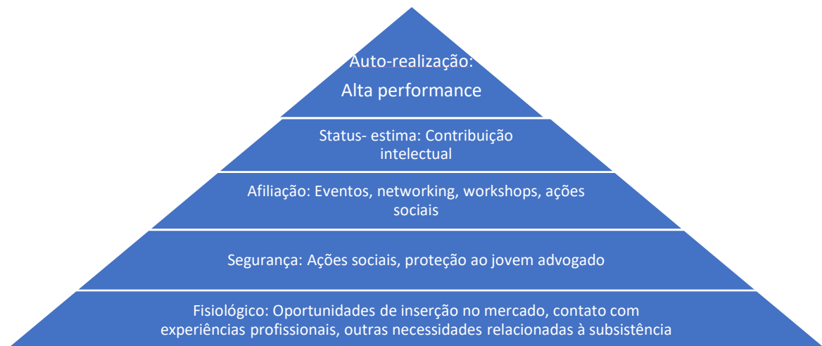
Figura 2: Pirâmide de Maslow aplicada aos projetos da Comissão

Assim, os novos projetos da CAAI-DF deverão fazer parte de um dos cinco grupo de necessidades intituladas como “essenciais”, segundo Abraham Maslow 1 , conforme se apresenta a seguir: